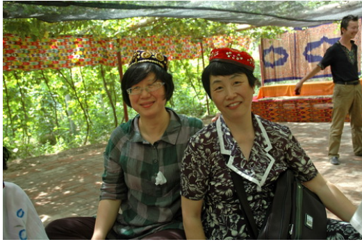
维吾尔族人家做客