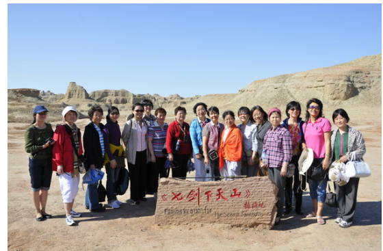
影片“七剑下天山”外景地